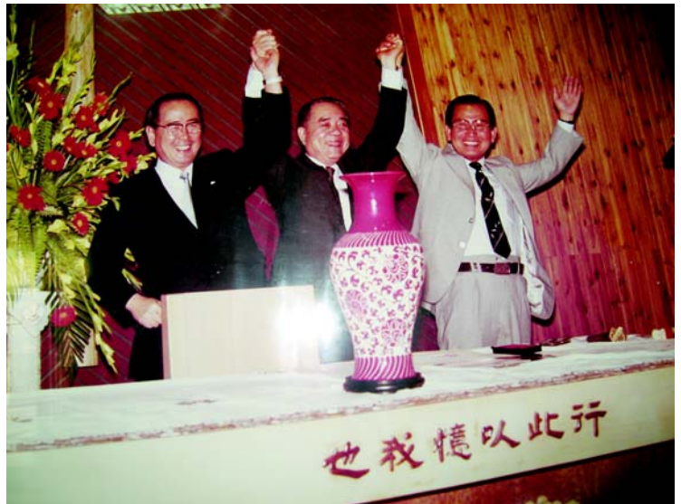
圖 4-4-1 三國姊妹教會牧師舉手慶賀之一

「日、韓、台三國姊妹教會聯誼會」的緣起來自於東北亞宣教會議，該會每二年定期在日、韓、台三國輪流舉行，會中大多是三國之中具有代表性的教會領袖或是被推派出席的宗教代表，齊聚一堂，共同研討宣教上的困境，思索突破和合作之道，共同為宣揚耶穌基督福音而努力。