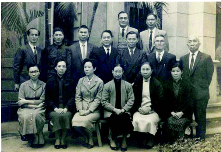
資料說明： 新興基督長老教會長執一 同合影，1960.01.10。